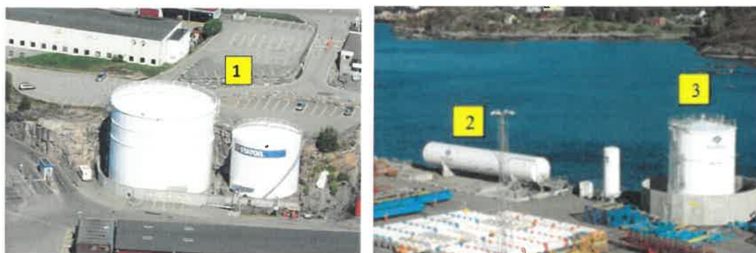
Figur 1 og 2 Bilde av hhv. MGO tanker (1) LNG tank (2) og Metanoltank (3)